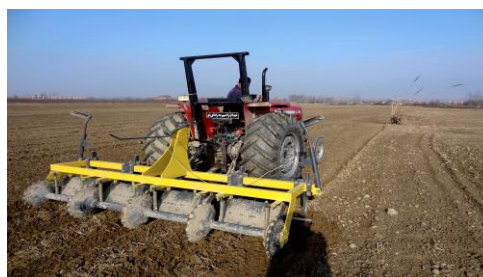
شکل ۱۰- استفاده از جویچه‌ساز غلتکی برای ایجاد بستر و شیار در مزرعه برای کشت روی پشته‌های بلند دائمی در سال اول

Figure 9- Reshaping the grooves or irrigation furrows in the system of long permanent beds without destroying the beds