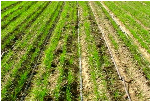
شکل ۳- استفاده از سیستم کشت روی پشته‌های بلند (به همراه