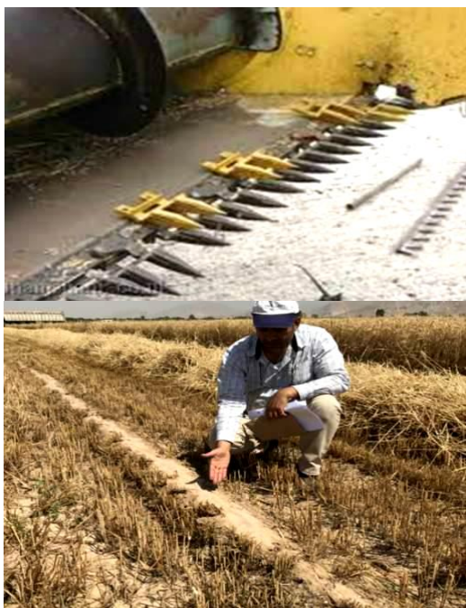
شکل ۶- آسیب به ماشین‌آلات برداشت محصول در روش کشت مرسوم گندم

مقداری خاک نیز همراه با محصول وارد مخزن کمباین می‌شود. در حالی که در کشت گندم روی پشته‌های بلند به علت کشت همه بوت‌ها روی پشته‌ها و حذف مرزهای آبیاری، برداشت محصول با ارتفاع بسیار کم و بدون برخورد تیغه‌های کمباین با خاک ممکن بوده و به‌طور خودکار یک روش دوست‌دار کمباین است (شکل ۶). کشت روی پشته‌های بلند به‌صورت موقت و دائمی انجام می‌شود: