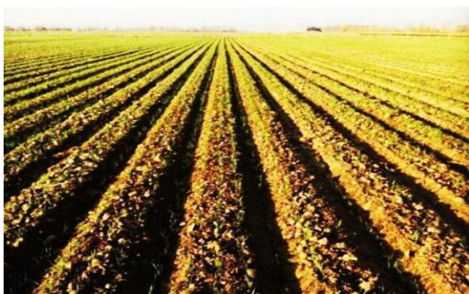
شکل ۴- کشت چند ردیف گندم روی پشته

در شکل ۴ نمونه‌ای از کشت گندم روی پشته نسبتاً عریض نشان داده شده است. در این روش آبیاری آب روی پشته سوار نشده و زمین غرقاب نمی‌شود. همچنین، به علت حرکت آب در داخل شیار، آب با سهولت و سرعت بیشتری به انتهای زمین می‌رسد و با رعایت سایر جوانب مورد نیاز، راندمان کاربرد آب در مزرعه تا ۸۰ درصد قابل افزایش است. در غلات، این روش آبیاری می‌تواند نسبت به آبیاری غرقابی ۵۰ درصد در مصرف آب صرفه‌جویی نماید. در این روش آبیاری در آبیاری اول (خاک آب) قسمت بالایی پشته‌ها به صورت صعود مویبندی و جریان روبه بالا خیس می‌شود تا بذرها بتوانند رشد ابتدایی خود را انجام دهند. با ریشه‌دوانی گیاه و رسیدن ریشه‌ها به عمق بیش‌تر از ۱۵ سانتی‌متر، نیازی نیست که قسمت بالایی پشته‌ها به صورت نشت خیس بشود و با آبیاری مناسب در آبیاری دوم و به بعد، قسمت بالایی پشته‌ها خیس نشده و تبخیر به شدت کاهش خواهد یافت (Tewabe et al., 2020; Rady et al., 2020). برای حصول نتیجه بهتر، توصیه می‌شود بذرها با عمیق کار کاشته شود تا نیازی به بالا بردن ارتفاع آب در جویچه آبیاری نباشد. همچنین، توصیه می‌شود گندم روی بقایای محصول سال قبل کاشته شود.