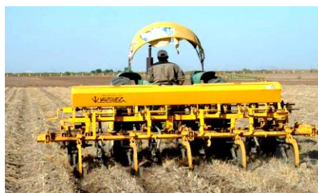
شکل ۹- شکل دادن مجدد به شیارها یا فاروهای آبیاری در سامانه بسترهای بلند دائمی بدون تخریب بسترها

گشته (شکل‌های ۹ و ۱۰) و سپس کشت بذر در زمان مناسب توسط کارنده مخصوص به‌صورت یک تا چهار خط روی هر پشته انجام شود و یا این‌که عملیات ایجاد پشته‌های بلند و کشت بذر روی پشته‌ها می‌تواند با یک ماشین کارنده جوی پشته‌ساز ویژه که برای کشت روی پشته‌های بلند ساخته شده است، به‌طور هم‌زمان و با یک‌بار تردد انجام شود.