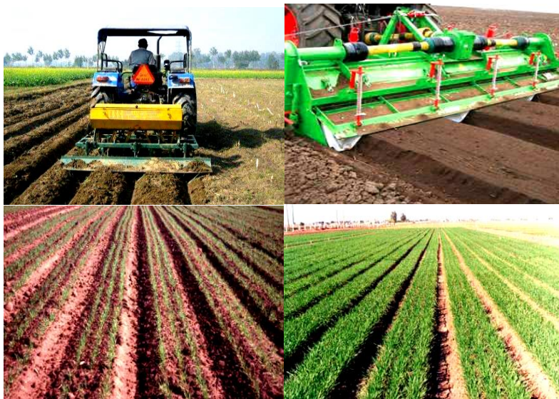
شکل ۷- ایجاد و شکل‌دهی پشته‌های بلند توسط ماشین پشته‌ساز ویژه و گندم کشت‌شده روی پشته‌های بلند موقت با ماشین کارنده ویژه Figure 7- Creation and shaping of raised beds by a special bed-making machine and wheat cultivated on temporary raised beds with a special planting machine

پشته‌ها فراهم شود. بنابراین، همه محصولات که در یک دوره تناوب کشت می‌شوند، روی یک بستر ثابت کاشته خواهند شد (شکل ۸).