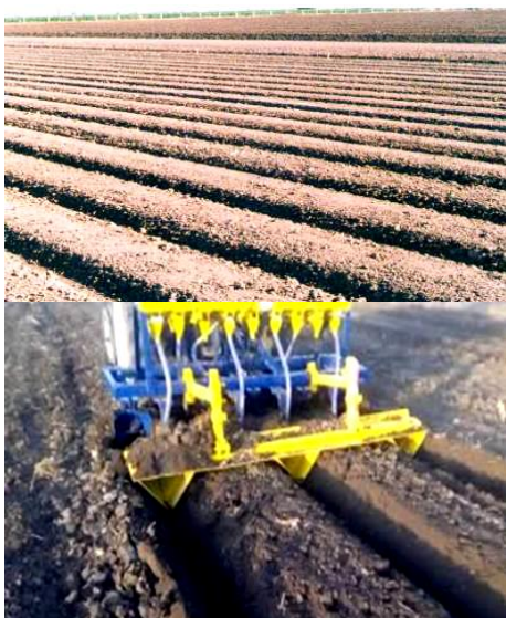
شکل ۸- ایجاد و شکل‌دهی پشته‌های بلند توسط ماشین پشته‌ساز ویژه با ماشین کارنده ویژه در مرحله گل‌خرابی Figure 8- Creation and shaping of raised beds by a special bed-making machine in the tillage stage

پشته‌ها فراهم شود. بنابراین، همه محصولات که در یک دوره تناوب کشت می‌شوند، روی یک بستر ثابت کاشته خواهند شد (شکل ۸).