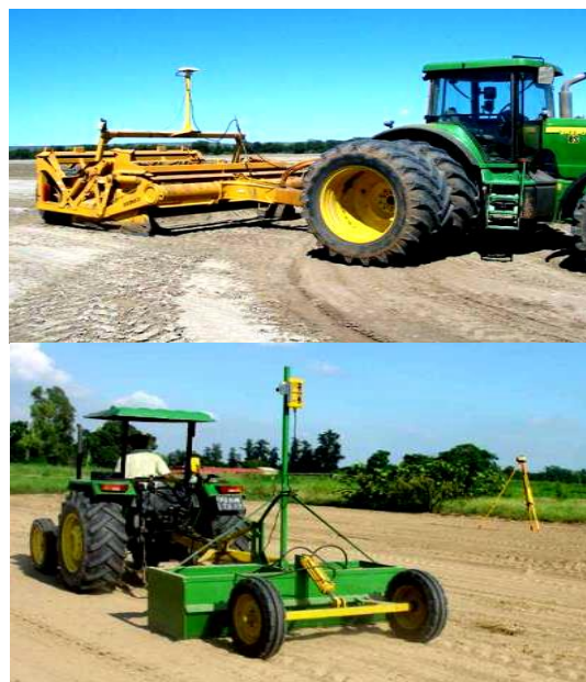
شکل ۵- تسطیح زمین توسط مسطح‌کننده لیزری Figure 5- Ground leveling by laser leveler

برای اجرای روش‌های نوین کشت بایستی زمین از تسطیح مناسبی برخوردار باشد؛ زیرا برای آبیاری یکنواخت مزرعه، بایستی زمین هموار بوده و دارای شیب یکنواخت و معینی باشد. اگر شیب کلی زمین مناسب بوده اما زمین کمی ناهموار باشد، انجام یک یا دو بار ماله (لولر) معمولی برای تسطیح زمین کفایت می‌کند. در صورت مناسب نبودن شیب کلی زمین و وجود ناهمواری زیاد در مزرعه، برای برخوردارگی کامل از مزایای کشت گندم روی پشته‌های بلند، لازم است زمین با ماله لیزری تسطیح اساسی شود و این کار هر پنج سال یک‌بار تکرار می‌شود (شکل ۵).