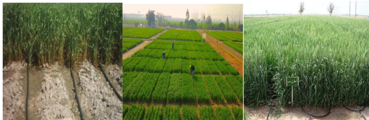
شکل ۳- استفاده از سامانه آبیاری قطره‌ای-نواری (تیپ) در زراعت گندم Figure 3- Use of drip irrigation system (tape) in wheat cultivation

از حدود ۳۰ سال پیش، سامانه‌های آبیاری میکرو به‌صورت فزاینده‌ای پا به عرصه کشاورزی گذاشته‌اند. به‌طوری‌که تاکنون سطح زیرکشت زیادی تحت پوشش این سامانه قرار گرفته است. راندمان بالای سامانه و امکان کنترل عملیات آبیاری و از طرفی خشک‌سالی، بحران آب و لزوم توسعه اراضی آبی بر اهمیت این سامانه افزوده و آمارهای موجود حاکی از روند افزایش صعودی استفاده از این سامانه نسبت به سایر سامانه‌ها است. در این میان آبیاری قطره‌ای نواری (شکل ۳) به‌عنوان یکی از روش‌های