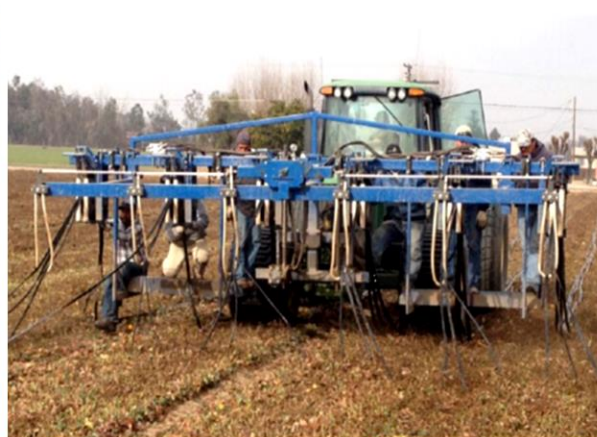
شکل ۴- تصاویری از دستگاه جمع‌آوری کننده نوارهای تیپ از مزرعه Figure 4- Pictures of the tape strips collecting device from the farm

با توجه به اعمال مقدار و دور آبیاری مشخص توسط کشاورزان، ظرفیت بالایی در بهبود و بازده آبیاری دارد (Shirinzhadeh et al., 2017).